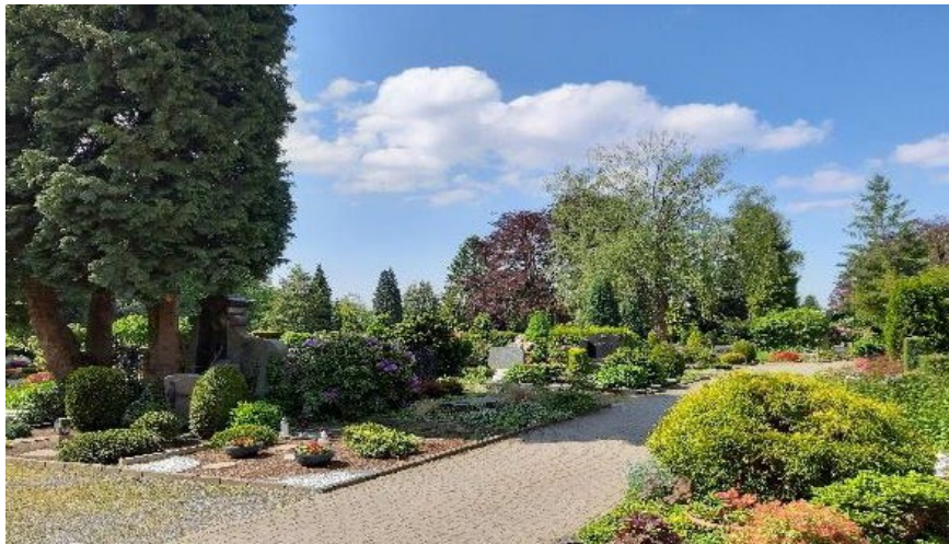
Anschrift: Altenberger Straße 16, 51399 Burscheid

der Friedhof der Stadt Burscheid bietet in seiner parkähnlichen Anlage mehr als nur Begräbnisstätten. Er ist sowohl ein Ort der Trauerbewältigung als auch der stillen Erholung.